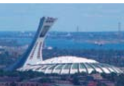
27 août 2002, 10 : 03 AM PM_{2,5} : 3 \mu g/m^3