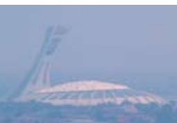
14 août 2002, 10 : 45 AM PM_{2,5} : 37 \mu g/m^3

Les effets toxiques des particules dépendent de leur taille et de leur composition. Celles dont le diamètre